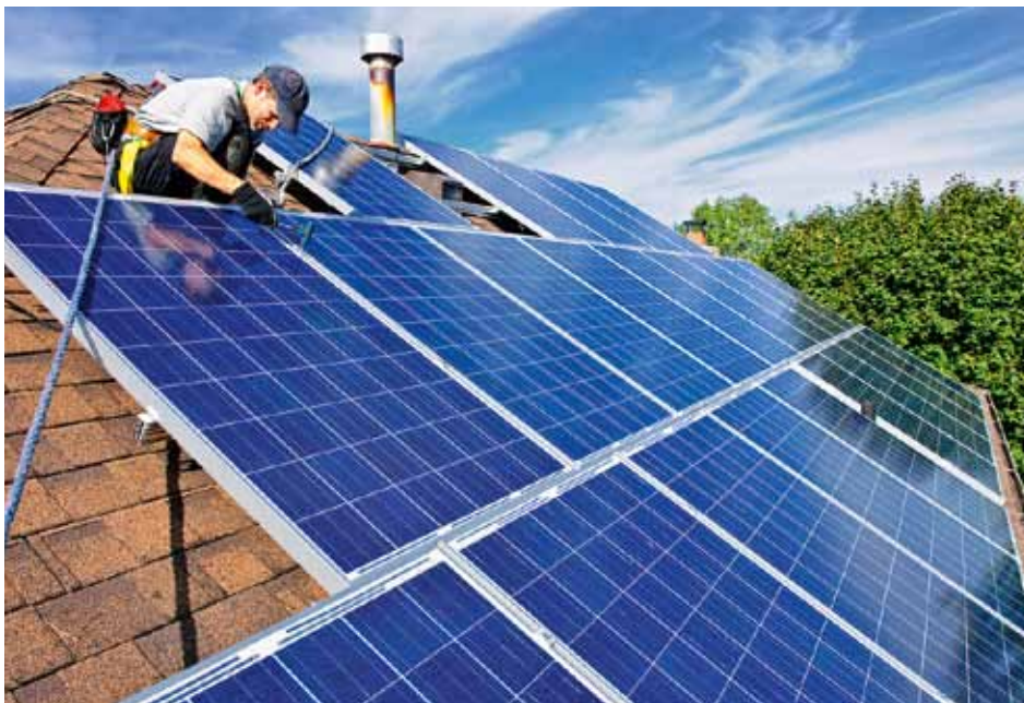
Ein Arbeiter bringt Solarkollektoren auf einem Dach an.

Aus Sicht des saarländischen Ministeriums für Umwelt, Energie und Verkehr stellt die Verbesserung der energetischen Qualität des Gebäudebestandes im Saarland beim Erreichen der Klimaschutzziele eine besonders große Herausforderung dar. Die Gründe dafür sieht das Ministerium darin, dass zum einen der Anteil von Ein- und Zweifamilienhäusern im Saarland besonders hoch ist und sich zum anderen die tatsächliche energetische Qualität des Gebäudebestandes als problematisch darstellt und deutlich unter dem Bundesdurchschnitt liegt. Hinzu